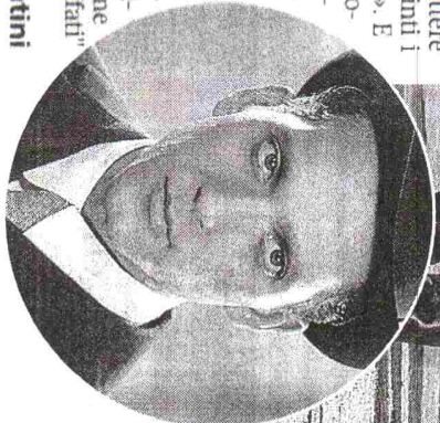
Giornalis Sopra Beppe Fiorello e Vincent Perez, la fiction che racconta la Banca Romana. Nel tondo un pannello con Beppe Fiorello: intepre